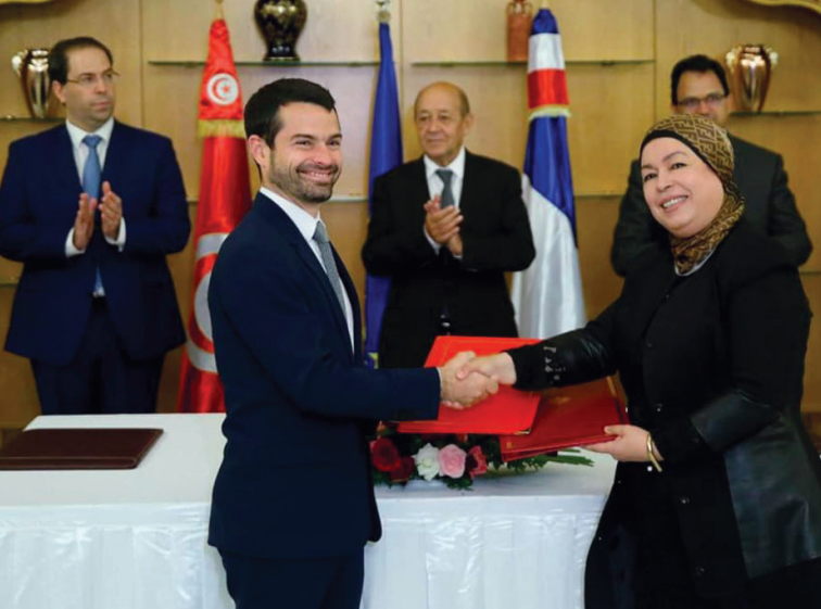
Signature de la convention du projet ENLIEN entre l'AFD et la CDC. Dar Dhiäfa, le 22 octobre 2018.

Le projet ENLIEN s'inscrit dans le cadre de l'initiative JET (Jeunesse, Entrepreneuriat et Numérique en Tunisie) financé par le Groupe AFD.